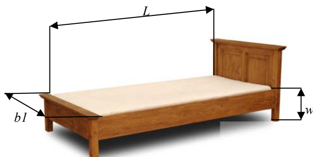
Obr. 2 Základné parametre jednolôžka. Fig. 2 Basic parameters of a single – bed.